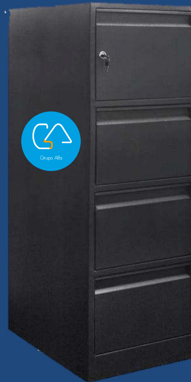
3 GAVETAS + CAJA FUERTE