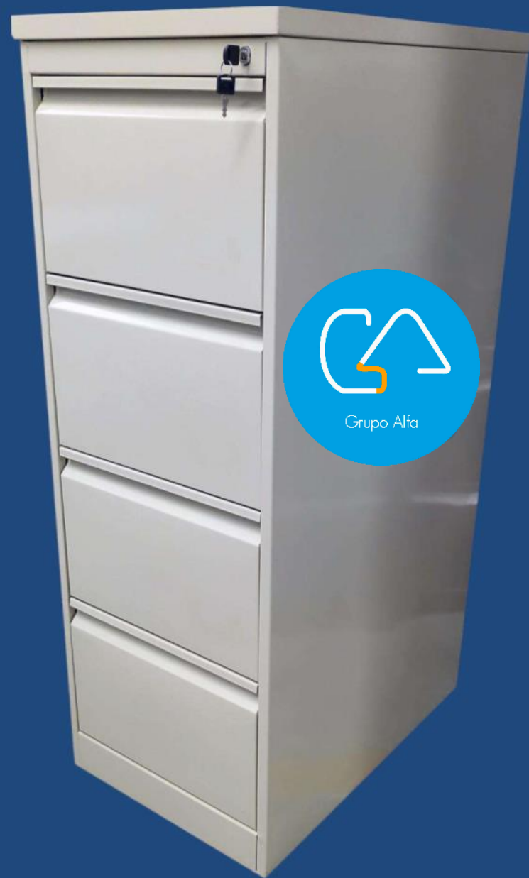
VERTICAL 4 GAVETAS