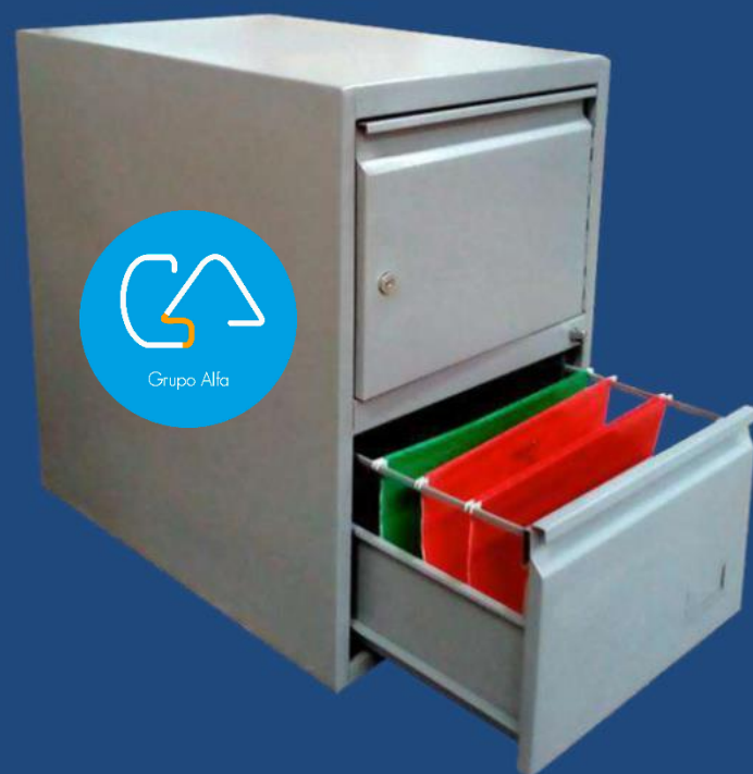
1 GAVETA + CAJA FUERTE