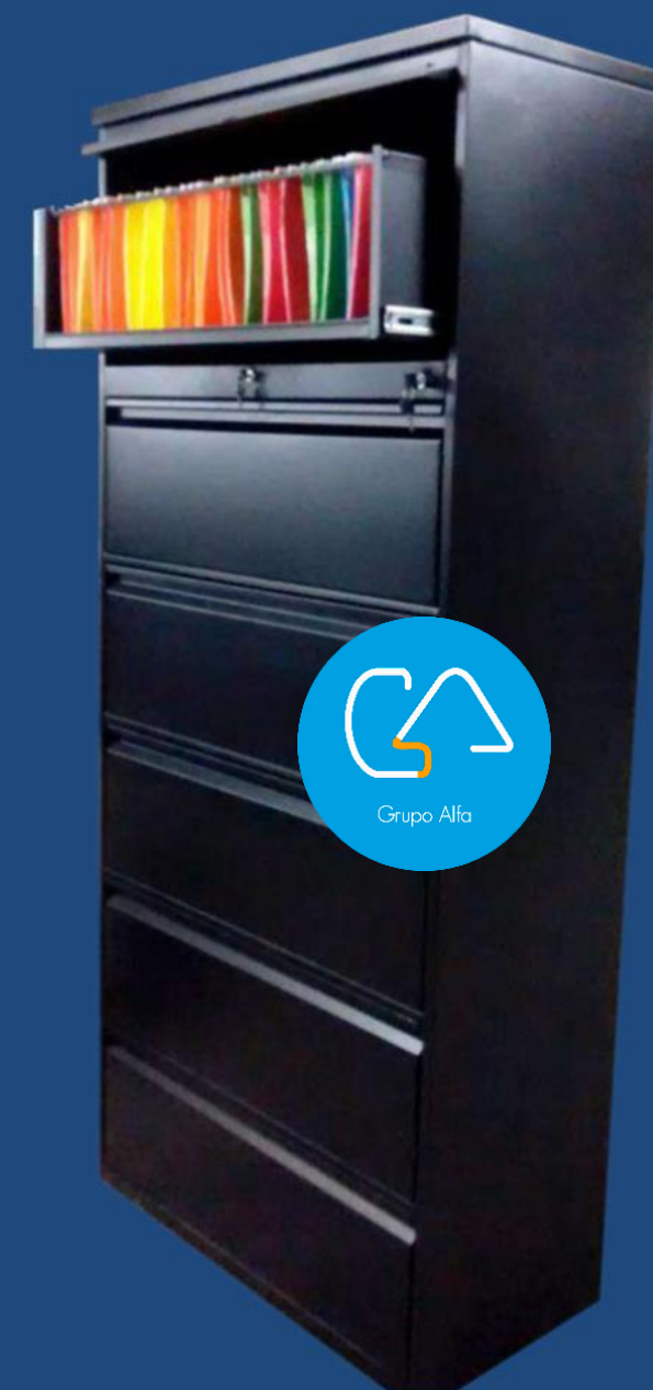
HORIZONTAL 6 GAV