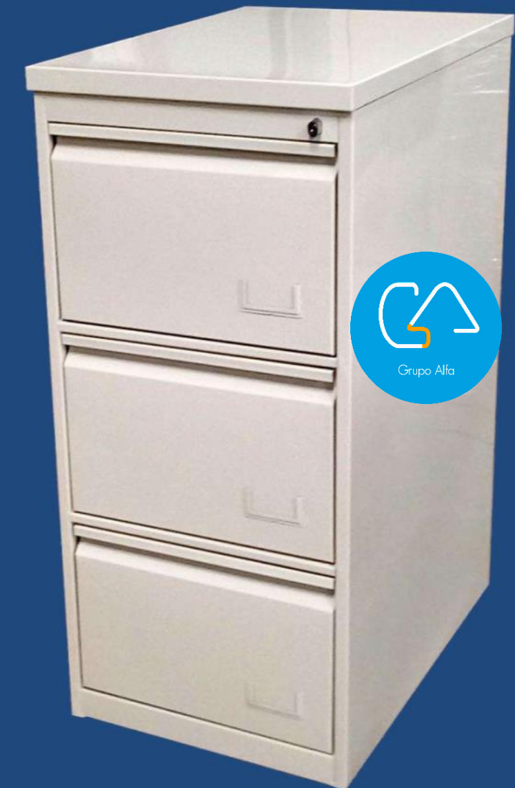
VERTICAL 3 GAVETAS