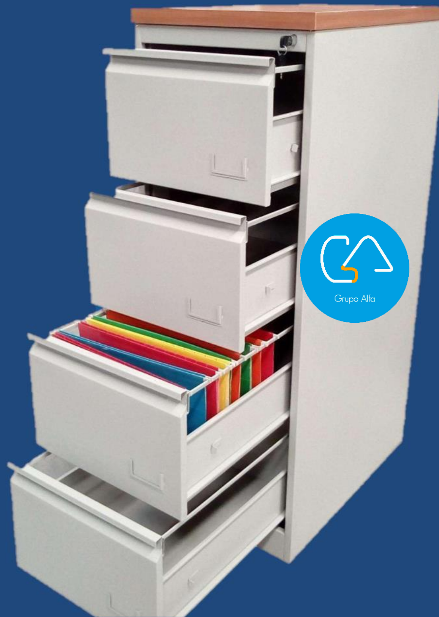
VERTICAL 4 GAVETAS CUBIERTA MADERA