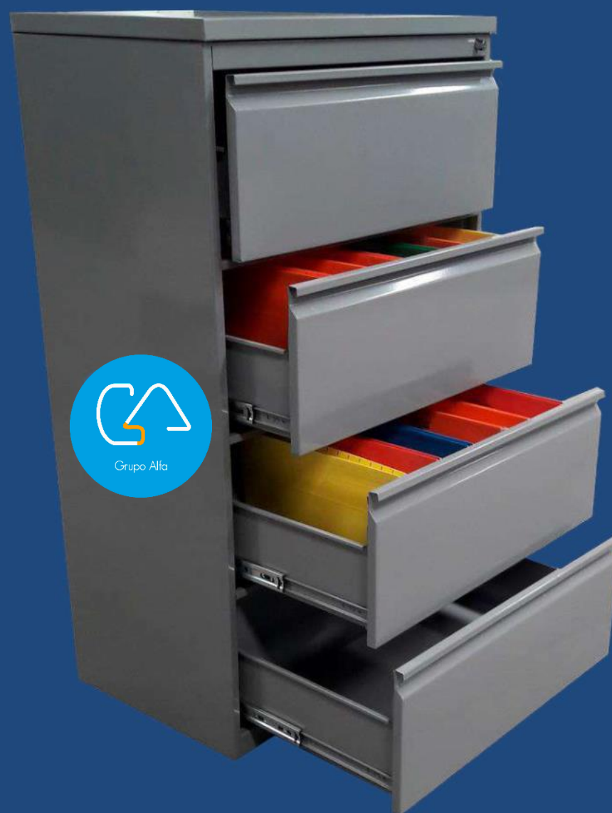
HORIZONTAL 4 GAVETAS