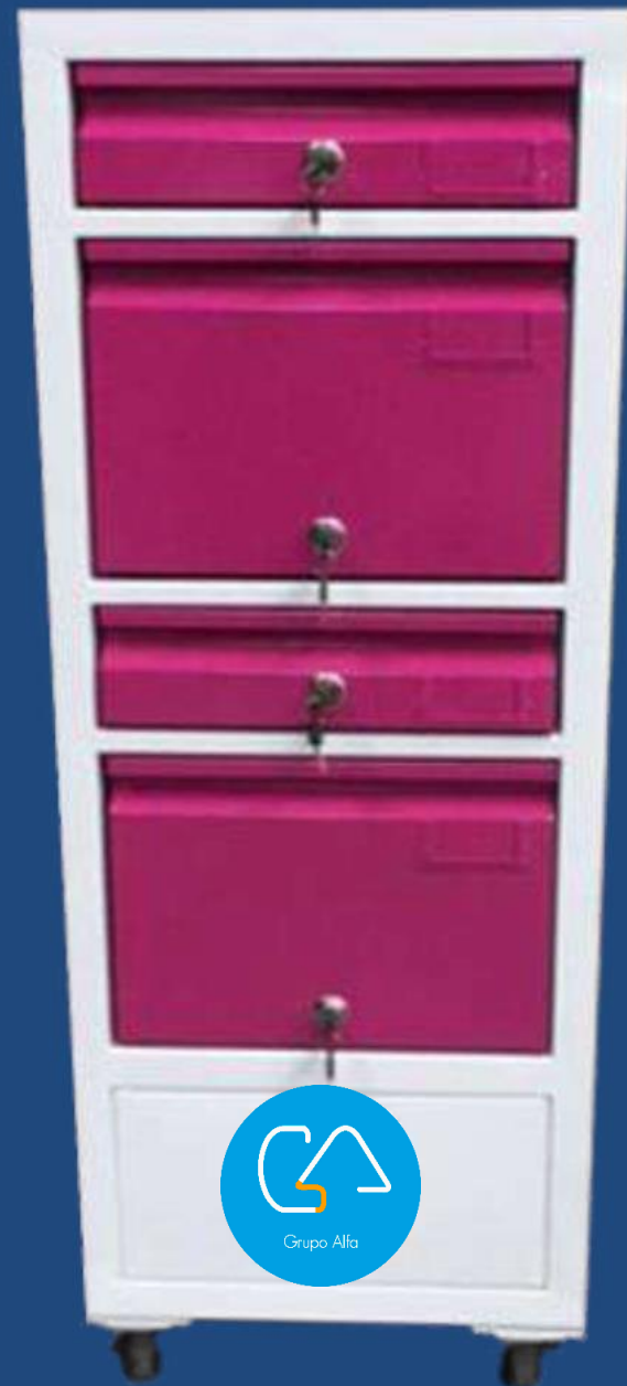
VERTICAL 4 GAVETAS +PUERTA