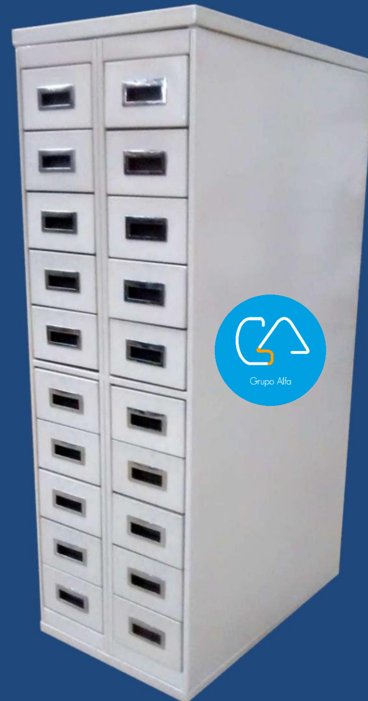
VERTICAL 20 GAVETAS