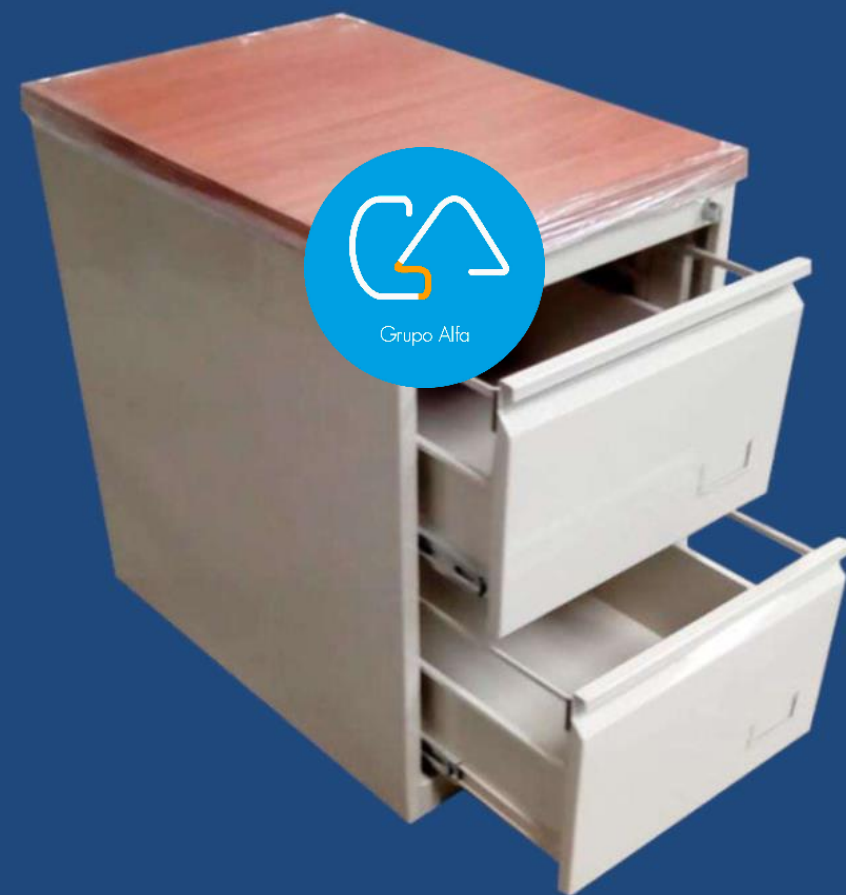
VERTICAL 2 GAVETAS CUBIERTA MADERA