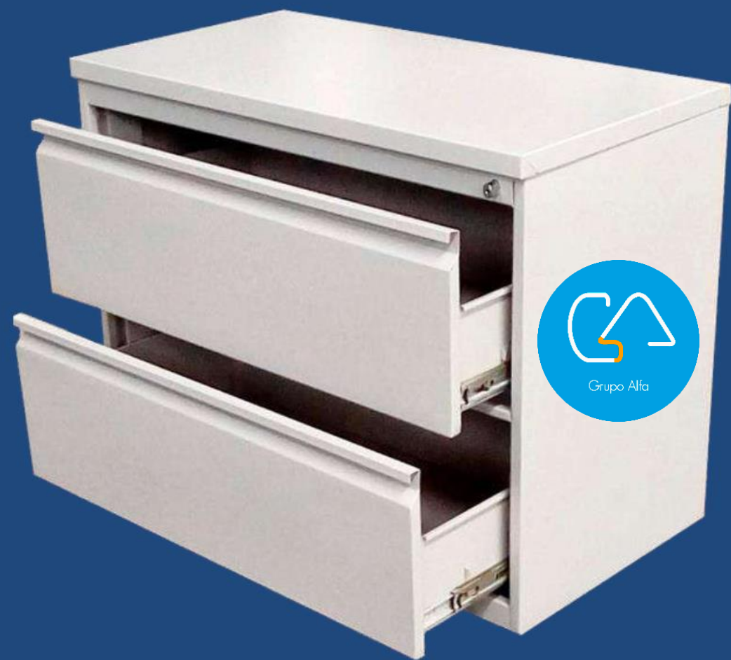
HORIZONTAL 2 GAVETAS